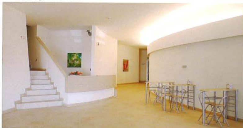
▼ Hall ingresso Sala B

La Sala A , sala principale dell'Auditorium, può ospitare fino a 945 persone con capienza modulare: