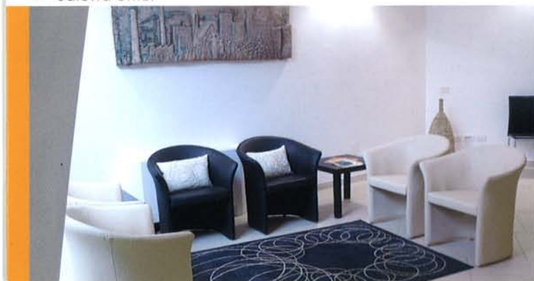
▼ Saletta uffici

Parcheggi. Sono disponibili due parcheggi: un parcheggio per auto, con una capienza di circa 220 posti, adiacente al centro; un parcheggio per 20 bus e 100 auto a circa 300 mt, collegato alla struttura da un percorso pedonale.