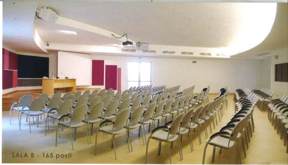
SALA B - 165 posti