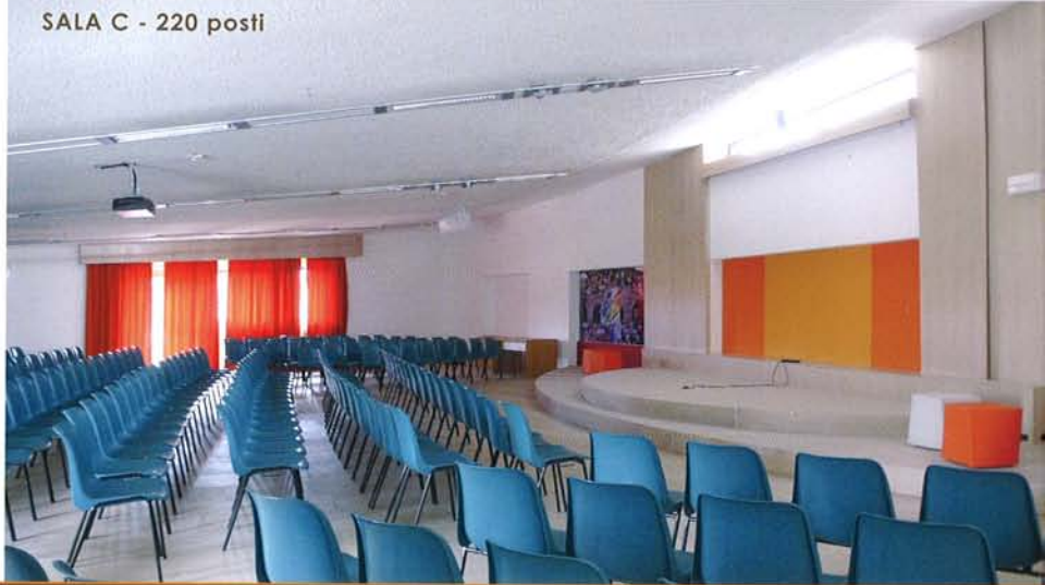
SALA C - 220 posti